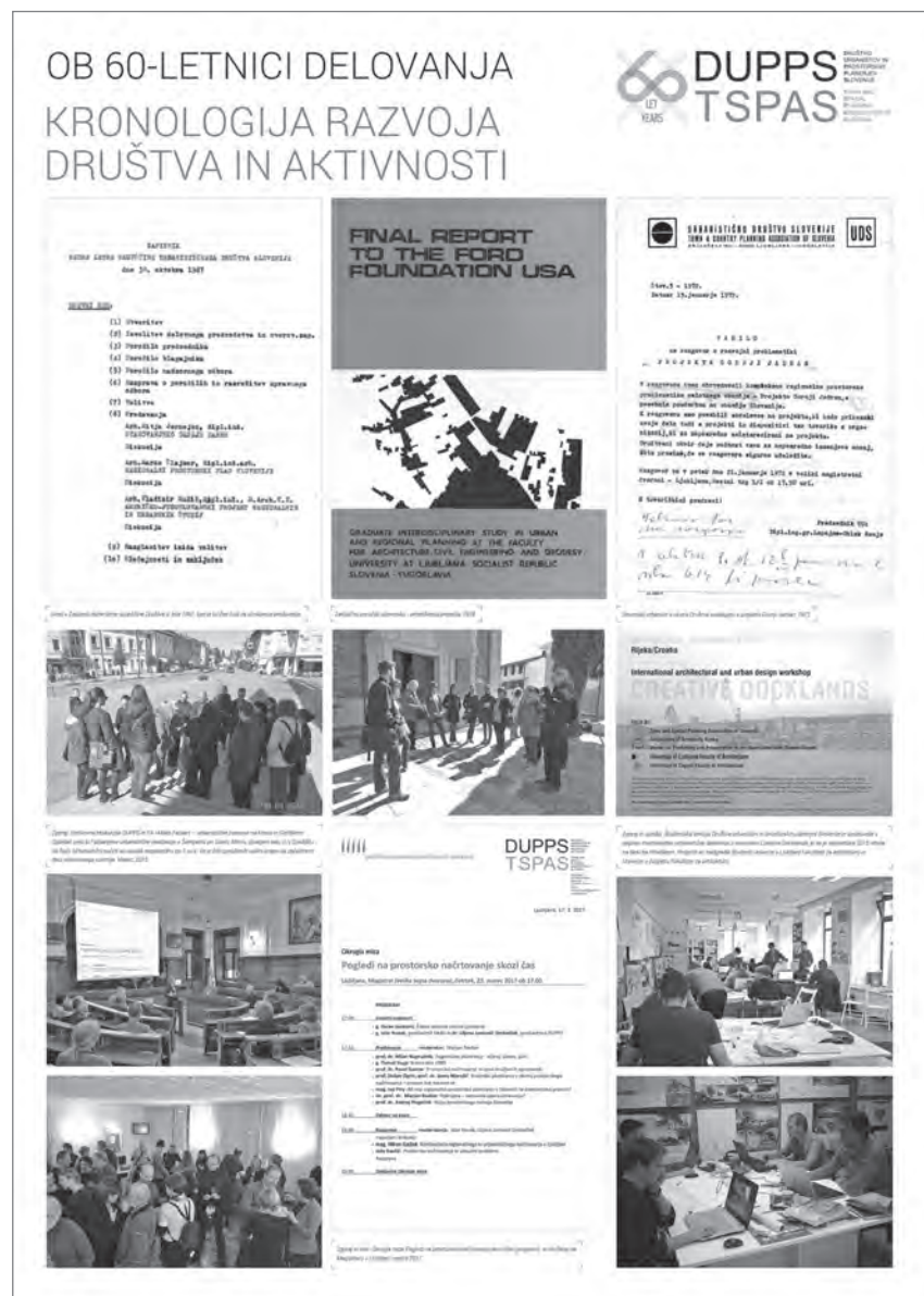
Slika 1: Kronologija razvoja društva in aktivnosti

Začetki organizacije urbanizma po drugi svetovni vojni pri nas segajo v petdeseta leta. Na prvem posvetovanju arhitektov urbanistov FLR Jugoslavije 1950 v Dubrovniku je imel prof. Edo Ravnikar referat Problemi arhitekture in urbanizma v LR Sloveniji, predvsem o urbanističnem planiranju in projektiranju naših mest. Zagovarjal je upoštevanje že obstoječe decentralizacije, v