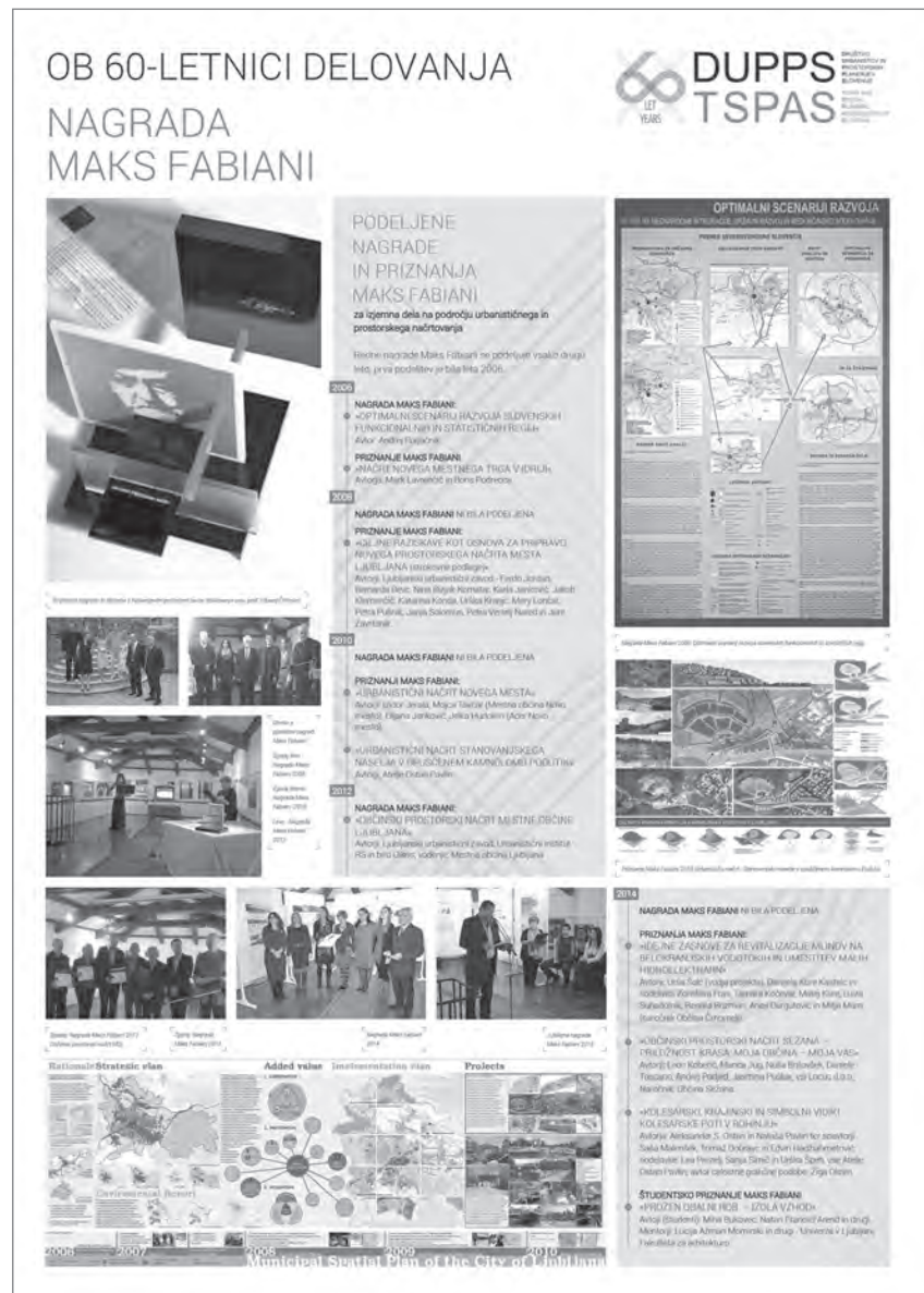
Slika 3: Nagrada Maks Fabiani (2006–2014)

Posebna, jubilejna mednarodna nagrada Maks Fabiani pa je bila organizirana leta 2015, za obdobje 10 let (ob 150-letnici rojstva). Po udeležbi in odzivih je bila zelo uspešna. Poleg Štanjela je bila prikazana tudi na razstavah v Ljubljani, na