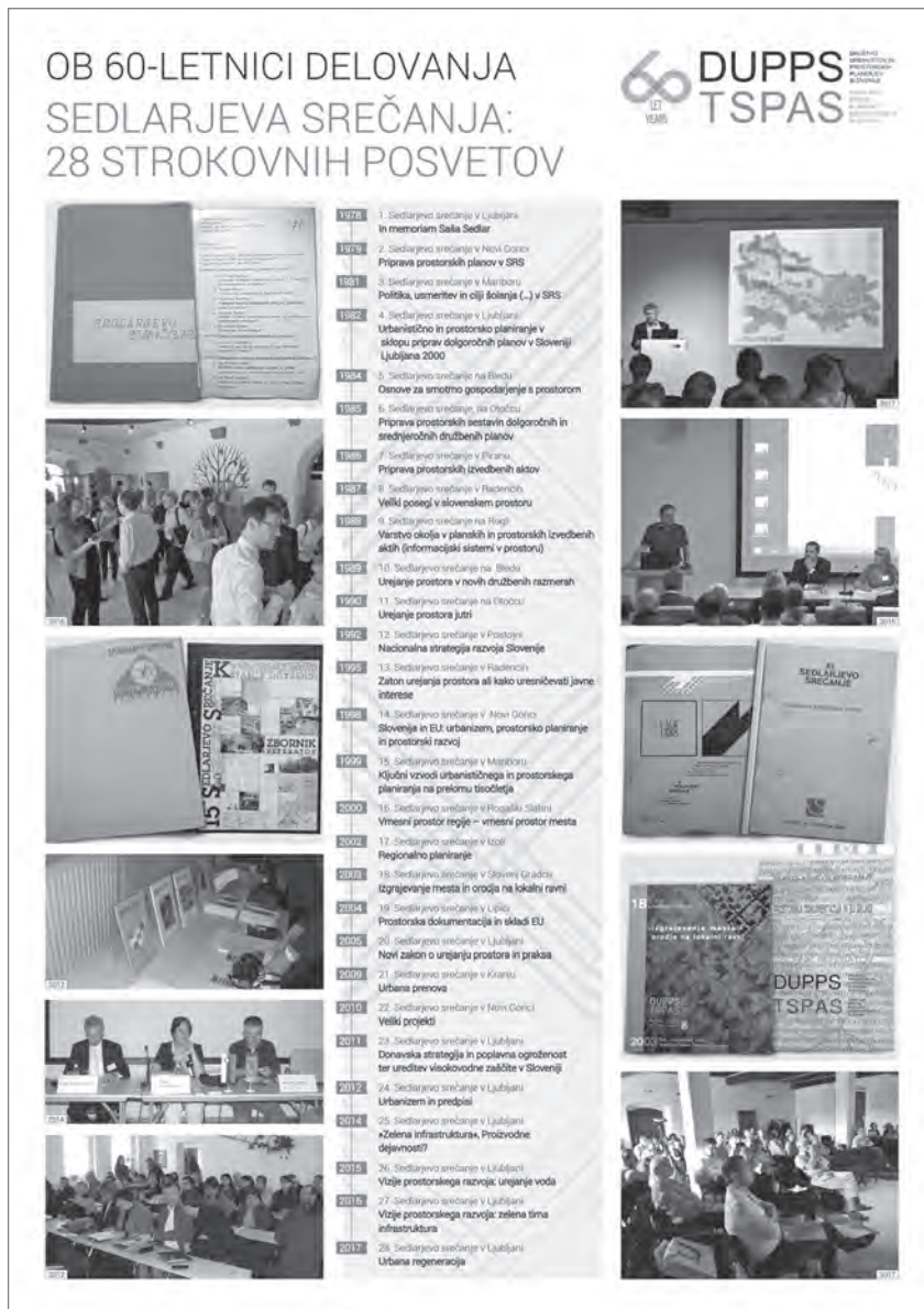
Slika 2: Sedlarjeva srečanja, 28 strokovnih posvetov (1978–2017)

službe v republikah in občinah. Poleg tega so opredelili usmeritve delovanja in pravila za ustanavljanje republiških društev.